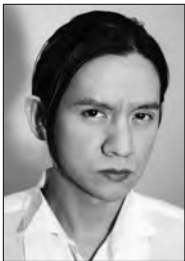
岡本健一 [おかもと・けんいち]

東京都出身。1985年、ドラマ「サーティーン・ボーイ」でデビュー。88年男闘呼組のメンバーとしてレコードデビュー。89年『唐版 滝の白糸』で初舞台。その後舞台を中心にドラマ、映画と幅広く活躍。『タイタス・アンドロニカス』(04)、『ヘンリー六世』(09)で読売演劇大賞優秀男優賞、『岸リトル』『ヘンリー五世』(18)で最優秀男優賞、『海辺のカフカ』