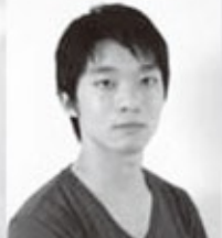
和久井幕太郎：平野尚