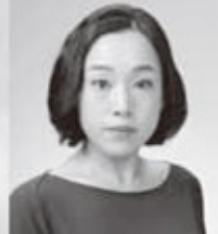
平木曾根：藤巻るも