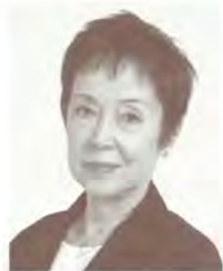
ならおかともこ 奈良岡 朋子